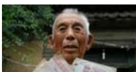
91岁拾荒老人18年资助路