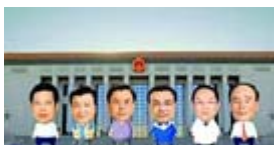
领导人卡通形象首现网络