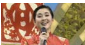
组图:历届春晚的女主持