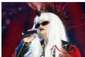
马云：像外星人一样行动