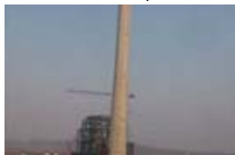
中国承建赞比亚火电厂