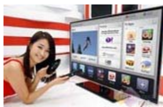
传统电视面临生死考验