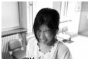
男子给iPhone4充电被电昏