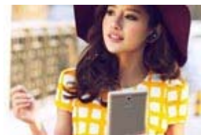
高关注通话平板推荐