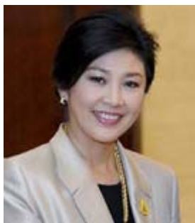
国际政坛“美女”排名