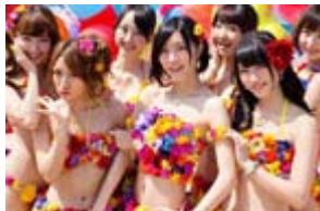
少女合体又萌 火辣