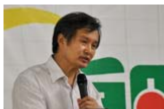
热水器会致人铅中毒？