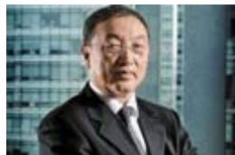
联想卖了酒又将卖水果