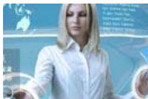
教你如何挑商务超极本