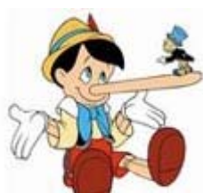
节能家电：知名企业也骗补