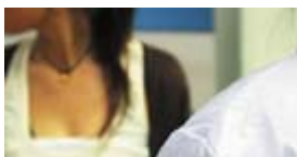
男医生遇上女患者