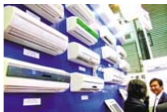
节后每台空调涨价200元左右