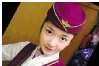
空姐被电死事件续