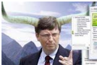
微软平板电脑回天无力